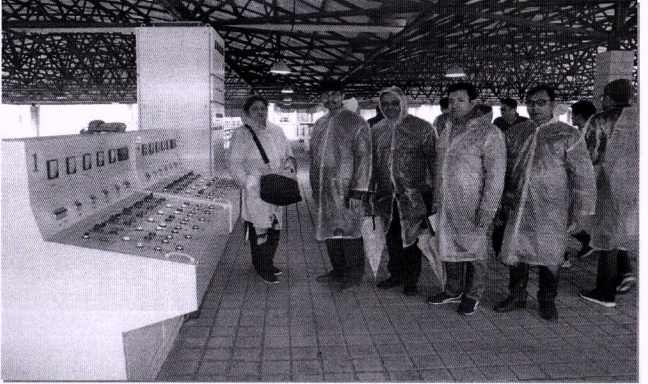
“হনান কন্সট্রাকশন ইঞ্জিনিয়ারিং গ্রুপ কর্পোরেশন (HCEG), চায়না” এর আমন্ত্রণে ভূপরিষ্ক পানি শোধনাগার নির্মাণের লক্ষ্যে গতিত “রাজশাহী ওয়াসা নেগোশিয়েশন টিম” এর সদস্যগণকর্তৃক HCEG নির্মিত চায়নাস্থ ভূপরিষ্ক পানি শোধনাগার পরিদর্শণ।