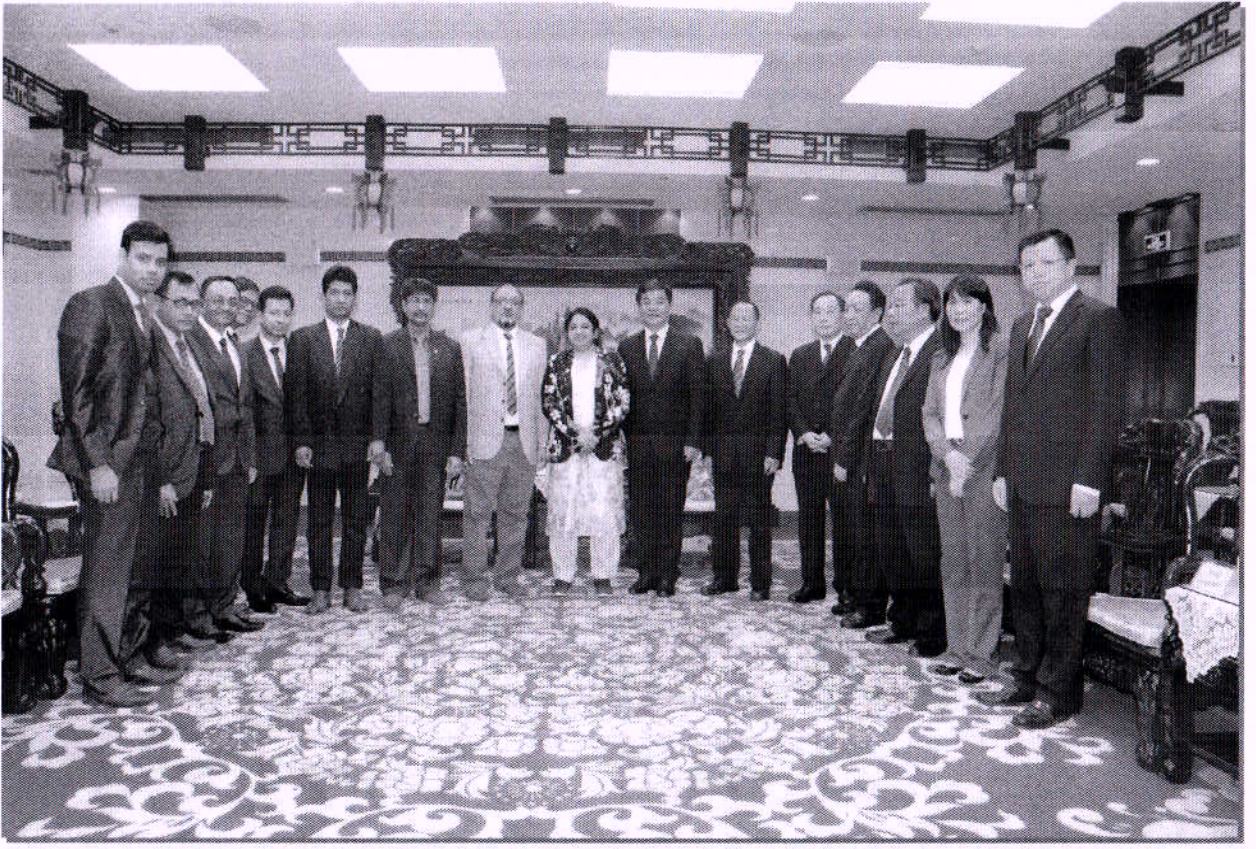
“রাজশাহী ওয়াসা ভূপরিস্থ পানি শোধনাগার” শীর্ষক প্রকল্প বাস্তবায়নের লক্ষে গভর্নর, হুনান প্রদেশ, চায়নার সাথে তাঁর কার্যালয়ে “রাজশাহী ওয়াসা নেগোশিয়েশন টিম” এর সৌজন্য সাক্ষাৎ।