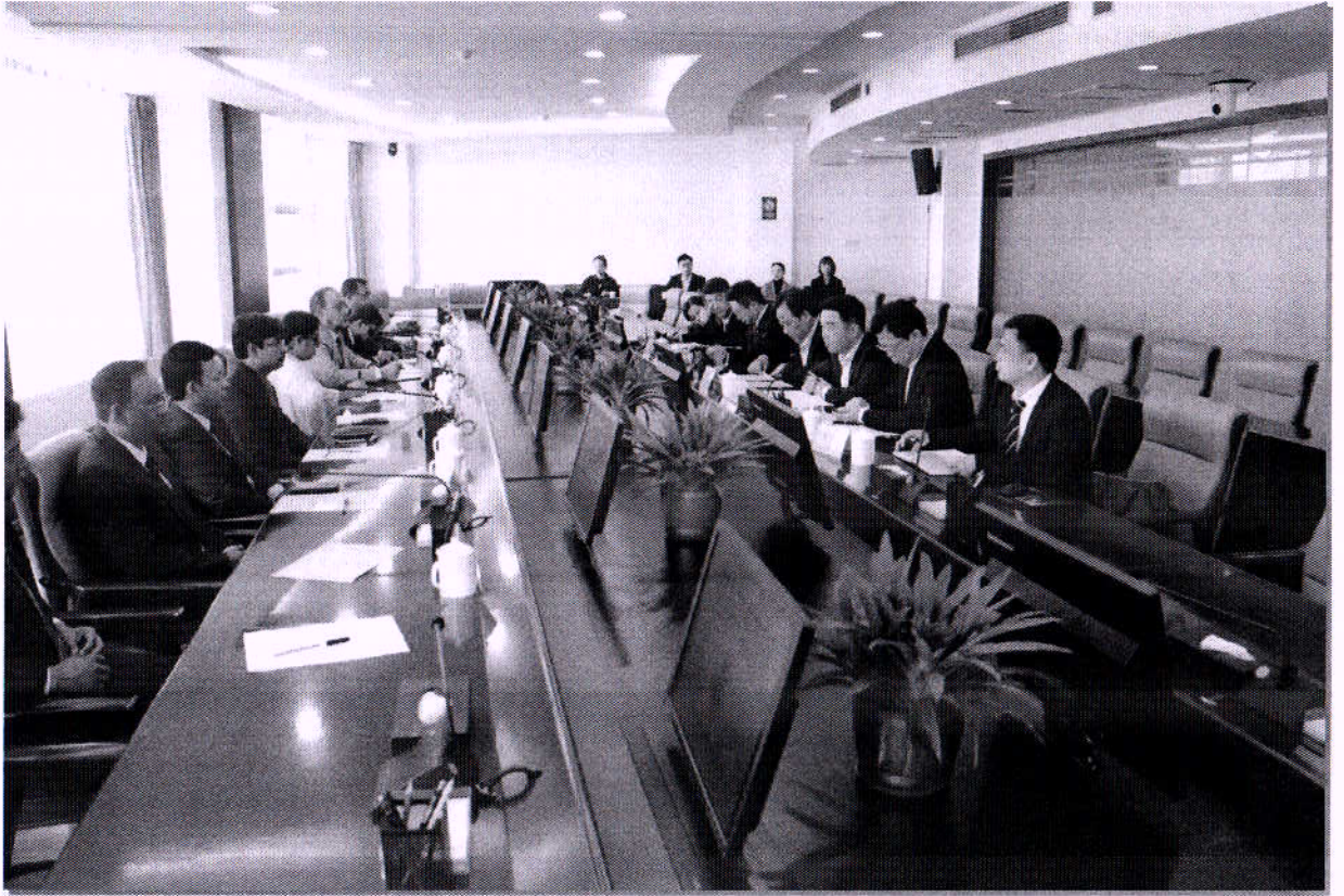
“রাজশাহী ওয়াসা ভূপরিস্থ পানি শোধনাগার” শীর্ষক প্রকল্প বাস্তবায়নের বিষয়ে “হুনান কন্সট্রাকশন ইঞ্জিনিয়ারিং গ্রুপ কর্পোরেশন (HCEG), চায়না” এর সাথে তাদের কার্যালয়ে অনুষ্ঠিত “রাজশাহী ওয়াসা নেগোশিয়েশন টিম” এর সভা।