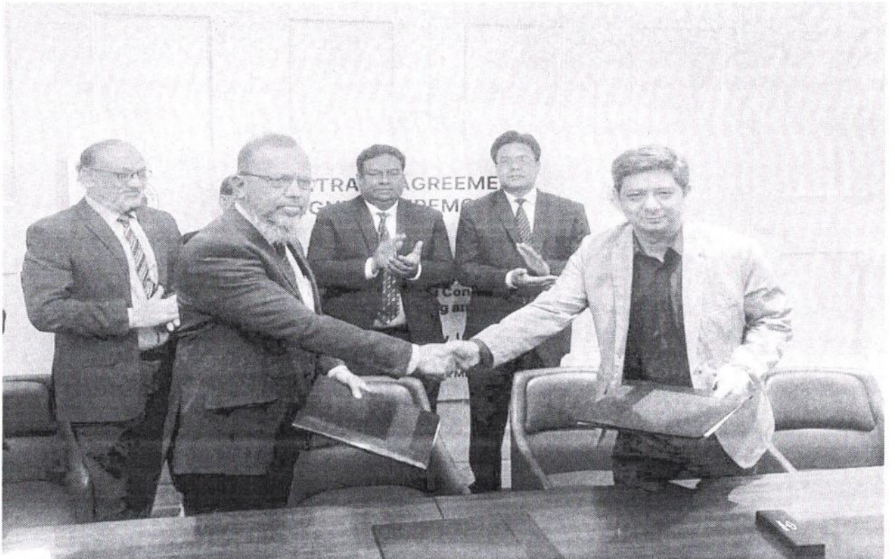
‘রাজশাহী ওয়াসার ডু-উপরিস্থিত পানি শোধনাগার’ শীর্ষক প্রকল্পে নির্বাচিত পরামর্শক প্রতিষ্ঠান BRTC, BUET & SMEC এর সাথে রাজশাহী ওয়াসার Contract Agreement স্বাক্ষর।