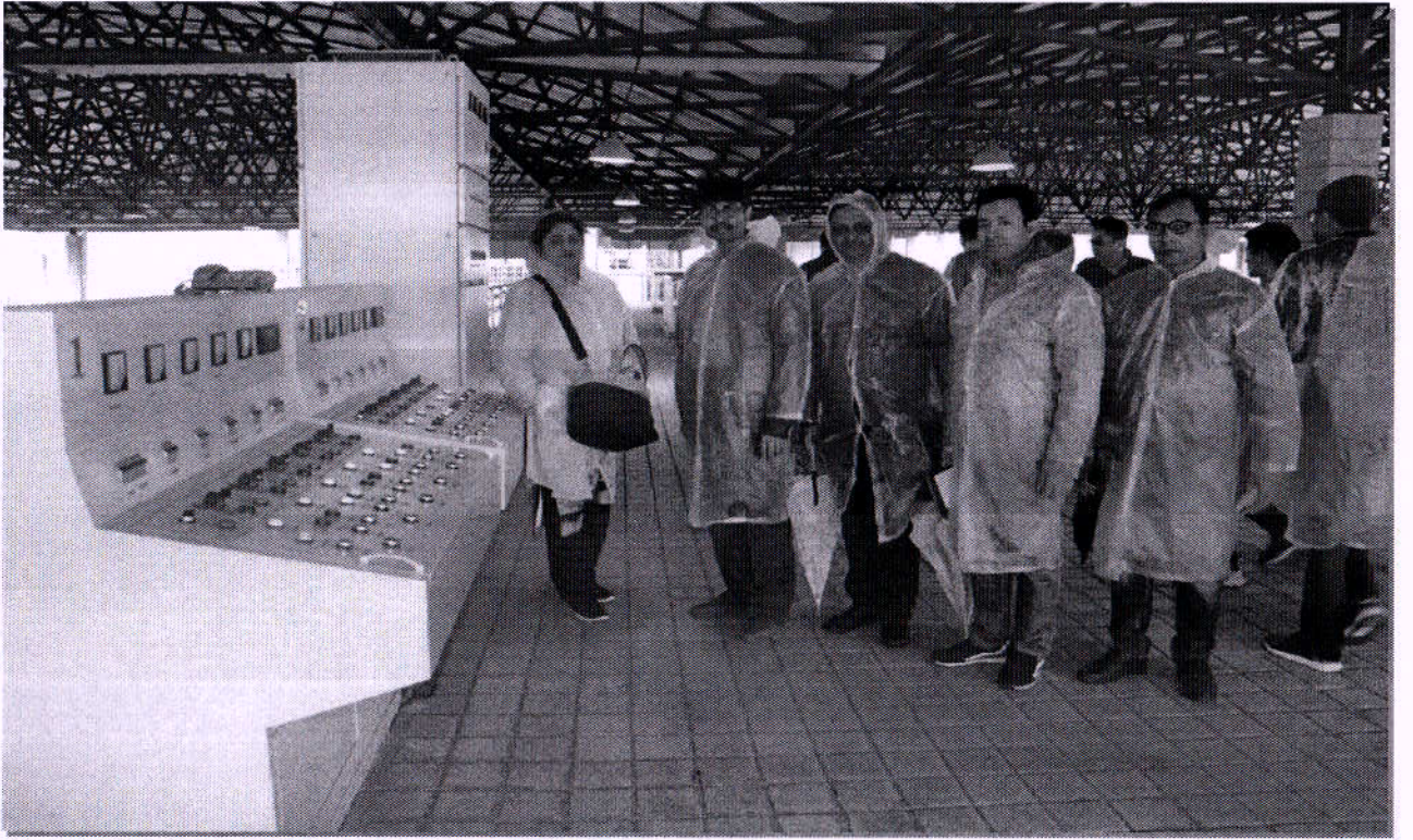
“হনান কন্সট্রাকশন ইঞ্জিনিয়ারিং গ্রুপ কর্পোরেশন (HCEG), চায়না” এর আমন্ত্রণে ভূপরিষ্ক পানি শোধনাগার নির্মাণের লক্ষ্যে গতিত “রাজশাহী ওয়াসা নেগোশিয়েশন টিম” এর সদস্যগণকর্তৃক HCEG নির্মিত চায়নাস্থ ভূপরিষ্ক পানি শোধনাগার পরিদর্শণ।